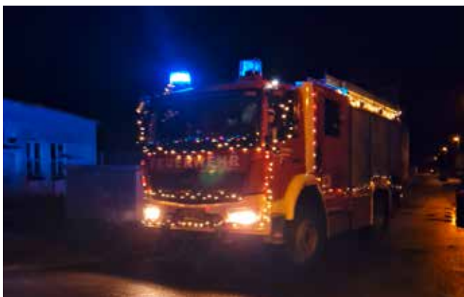
Weihnachtsgrüße aus der Gemeindewehr