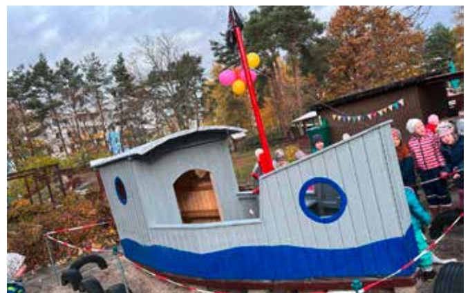
Schiff Ahoi in der Kita Pfiffikus