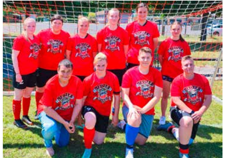
Kreismeister 2023: Die SpG Straßgräbchen/Wittichenau in ihren Meistertrikots

Die Sportgruppen Gymnastik trainieren weiterhin regelmäßig und haben sich zahlenmäßig verstärkt. Gleiches trifft auch auf die Volley-