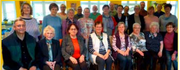
Chorgemeinschaft Schwepnitz/Cosel e. V.