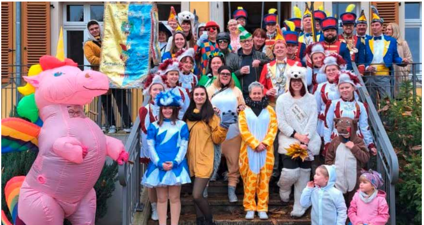
Gelungener Auftakt der 71. Karnevalssaison

Amts- & Mitteilungsblatt der Stadt Bernsdorf mit den Ortsteilen Großgrabe, Straßgräbchen, Wiednitz, Zeißholz 02.12.2023