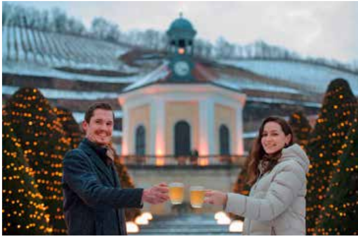
In winterlicher Atmosphäre wärmende Gaumenfreuden genießen: zum Beispiel auf Schloss Wackerbarth.