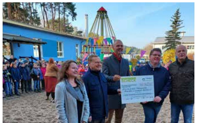
Bewegte Pause in der Grundschule