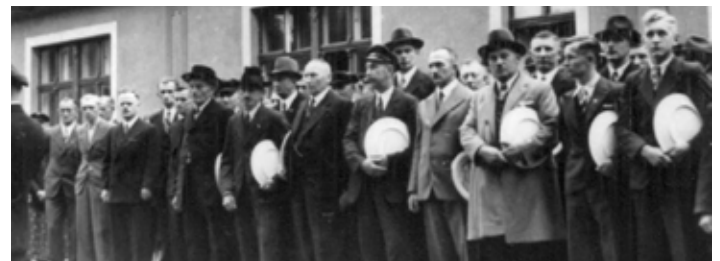
Auszeichnung verdienstvoller Mitarbeiter mit einem Dekor-Teller