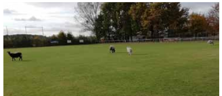
Die Ruhe nach dem Sturm: friedlich weiden Schafe auf dem Sportplatz in Straßgräbchen