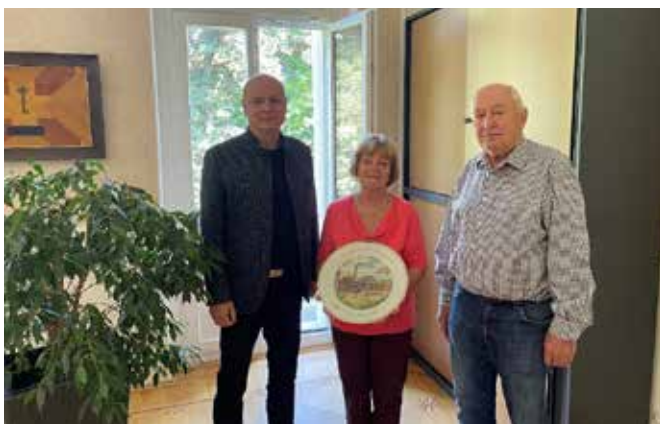
Ein besonderer Dekor-Teller

Das gesamte Team der Stadtverwaltung Bernsdorf wünscht Ihnen eine besinnliche Adventszeit und ein schönes Weihnachtsfest.