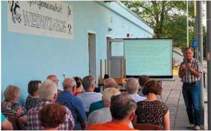
Verkehrsteilnehmerschulung Open Air...