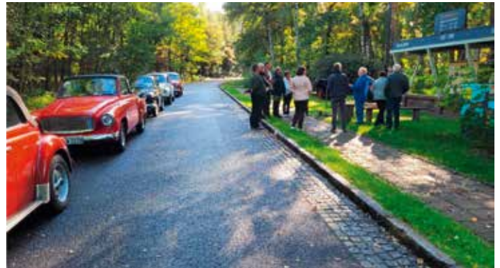
Oldtimerfreunde bei der Führung in Heide