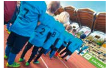
Das Team der Grundschule Bernsdorf