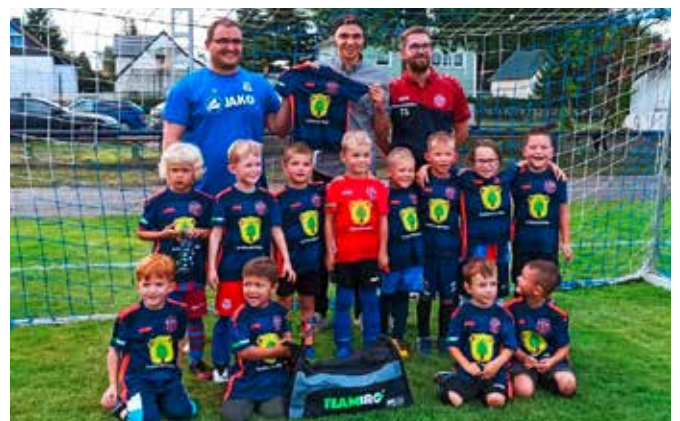
Neue Trikots für die Kinder der BSW Lausitz 2016