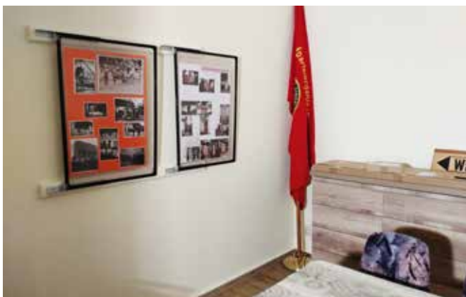
Raumertüchtigung zum Ortsarchiv im Dorfgemeinschaftshaus Großgrabe