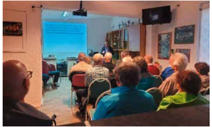
... und im Vereinsraum auf dem Sportplatz