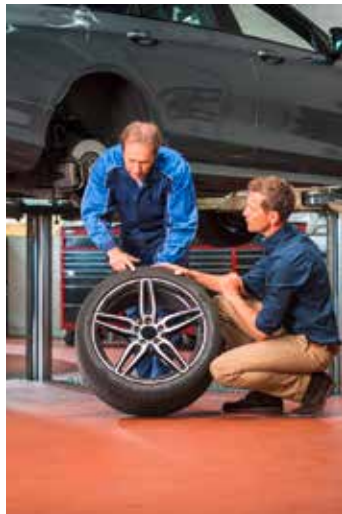
Die Kfz-Fachwerkstatt kontrolliert eingelagerte Winterreifen vor der Montage auf Profiltiefe und Schäden.

Text: djd