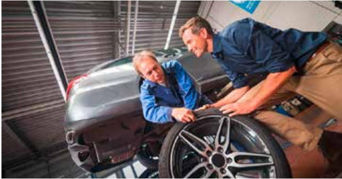
Kfz-Experten raten, ab Oktober Winterreifen aufs Auto zu montieren

Überlegene Bodenhaftung, egal wie das Wetter auch wird