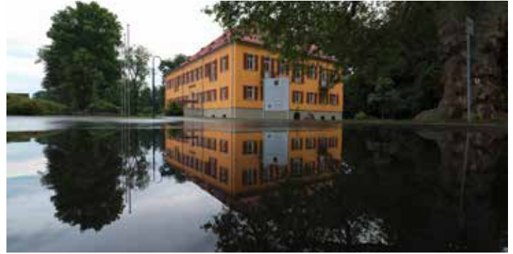
Das Gelände um das Bernsdorfer Rathaus nach einem Starkregen Ende 2021

Der Zeitraum zur Realisierung der kurzfristigen Verhaltensvorsorge ist im Fall des Eintritts eines Starkregens sehr kurz. Schnelles Handeln ist also erforderlich. Im Fall des eintretenden Starkregens stellen Sie bitte sofort in allen gefährdeten Räumen den Strom ab und vergewissern Sie sich, dass keine wasserempfindlichen oder wasserschädigenden Gegenstände