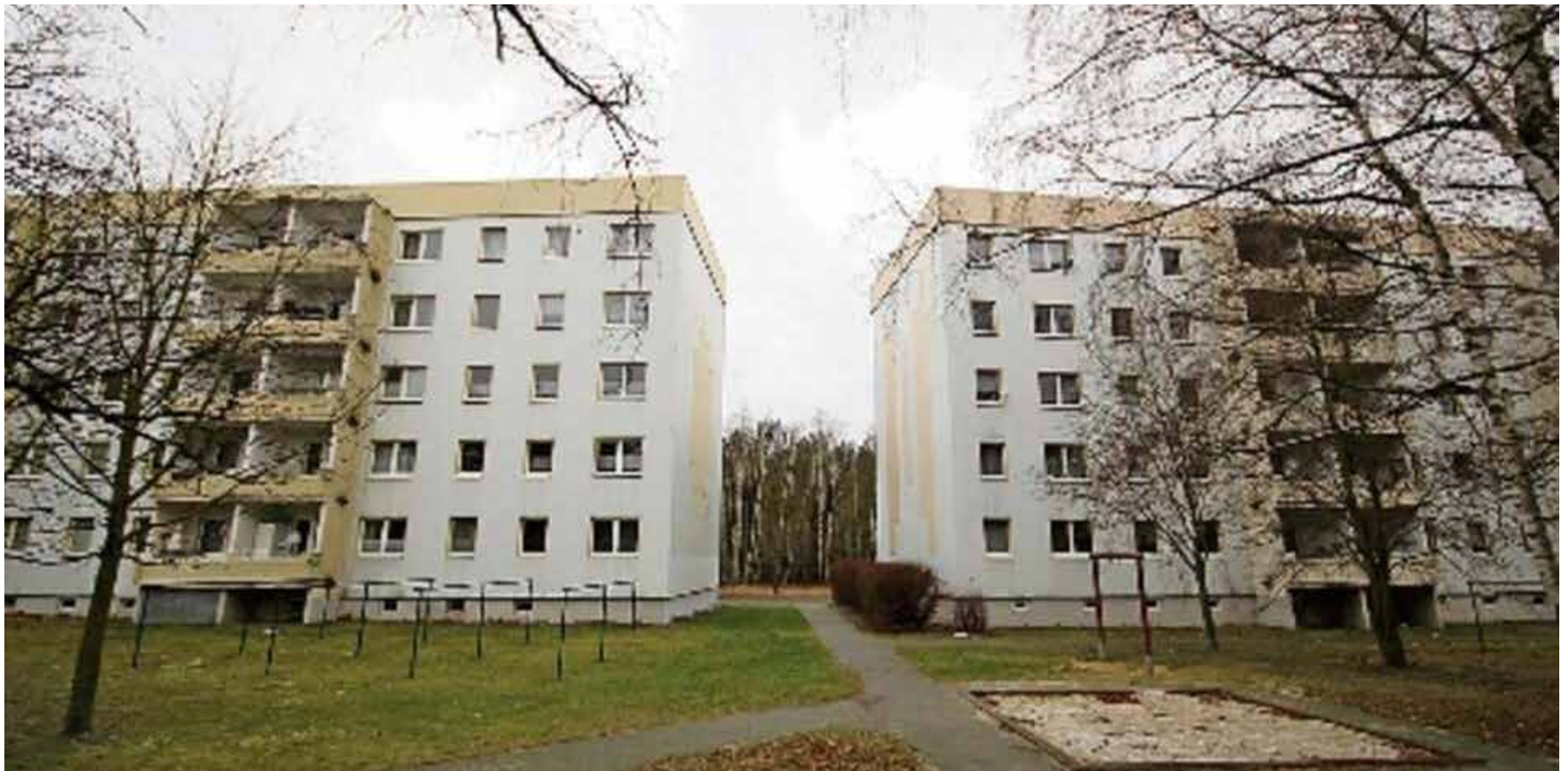
Diese beiden Wohnblöcke im Bernsdorfer Fritz-Kube-Ring werden derzeit für seniorenfreundliches betreutes Wohnen umgebaut. In der Baulücke ist ein Begegnungszentrum geplant.