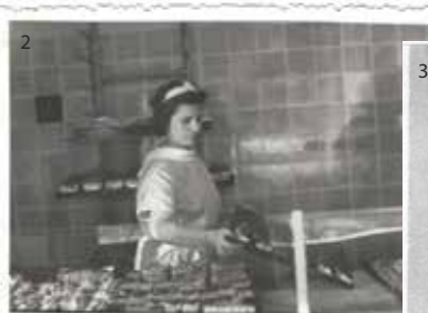
1 Die Bäckerei 1985