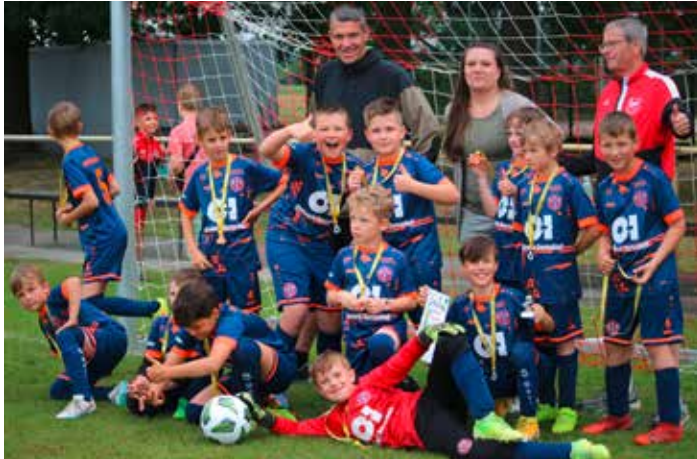
Freude über die Bronzemedaille bei den Kickern aus dem Meisennest in Straßgräbchen