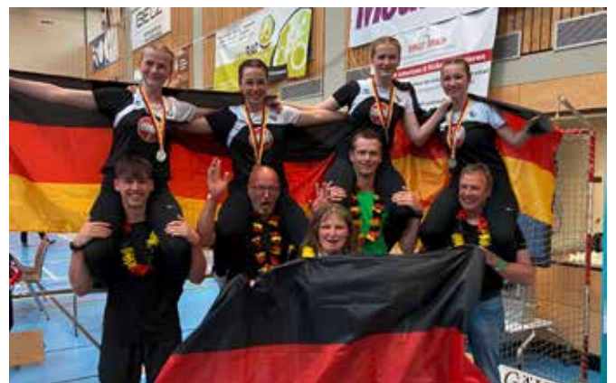
Wiednitzer Quartett ist deutscher Vizemeister