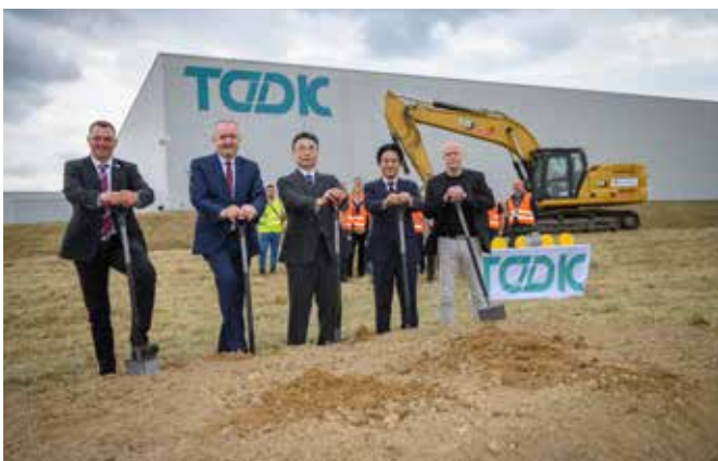
Erster Spatenstich für Erweiterungsbau bei TDDK