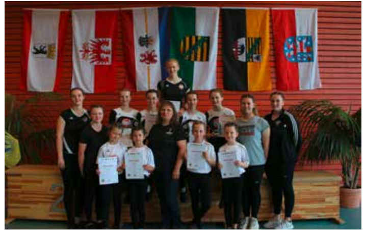
Team Wiednitz bei der ODM in Berlin

aus der Heimat von denen, die dem Livestream gefolgt waren. Ab der nächsten Saison startet dieses Team dann bei den Junioren und stellt sich den neuen Herausforderungen.