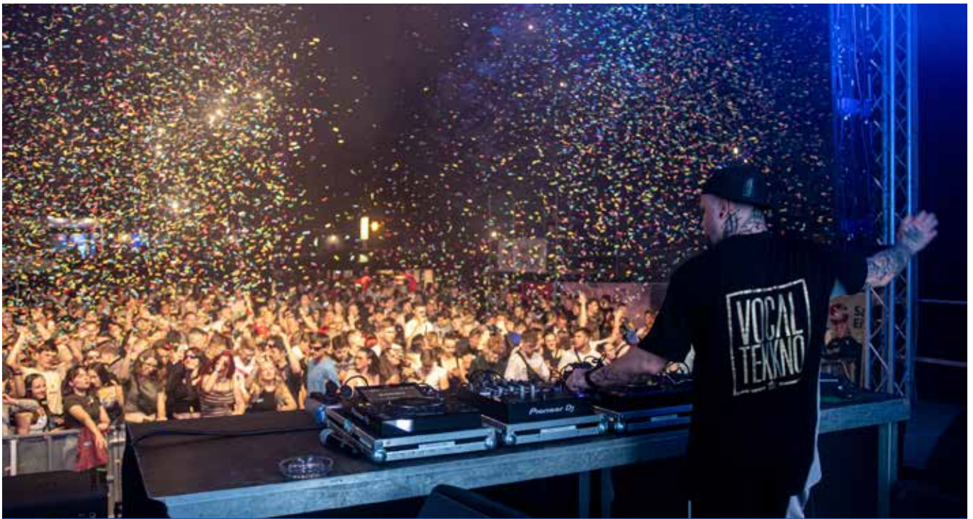
Summer Open Air in Straßgräbchen

Amts- & Mitteilungsblatt der Stadt Bernsdorf mit den Ortsteilen Großgrabe, Straßgräbchen, Wiednitz, Zeißholz 08.07.2023