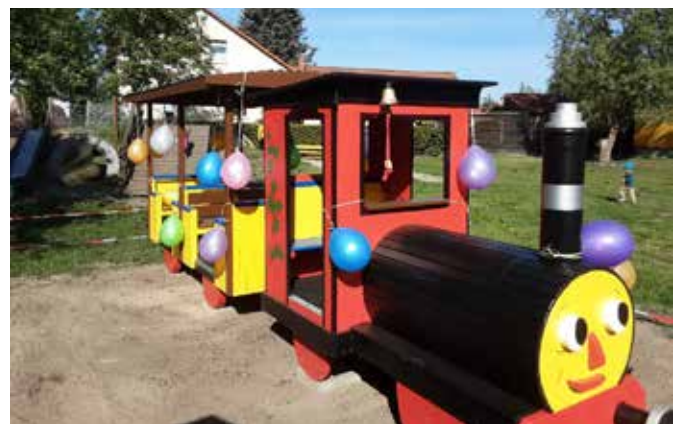
Große Wiedersehensfreude in der Kita Kinderland