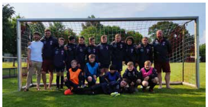
Nach der Übergabe ist den Spielern der Stolz auf die neuen Jacken anzusehen.