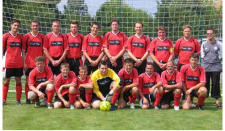
Diese Mannschaft weihte vor 15 Jahren den Rasenplatz in Straßgräbchen ein:

Auffällig bei allen genannten Projekten ist, dass die Vereinsmitglieder nicht nur die Hand aufgehoben und staatliche oder kommunale Förderung