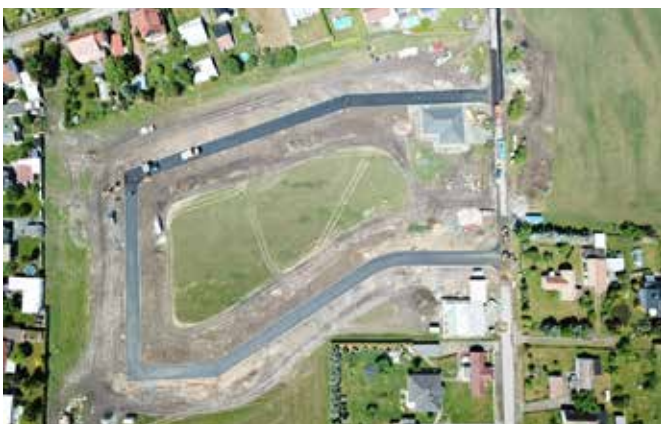
Erschließung des Baugebietes Friedrich-Engels-Straße abgeschlossen