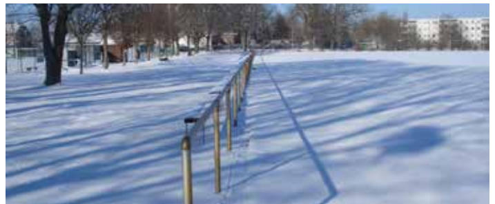
Der Rasenplatz in der Winterruhe