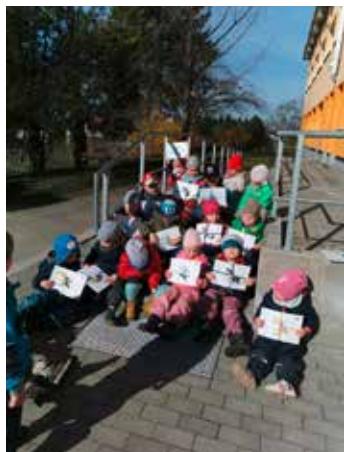
Die Kinder aus dem „Meisennest“ mit ihrer Osterüberraschung

Sie Sonne lachte und freute sich mit den Kindern der CSB-Kindertagesstätten „Meisennest“ in Straßgräbchen und „Fuchs und Elster“ in Wiednitz über die Osternester, welche die Kinder mit großer Freude suchten – und auch fanden.