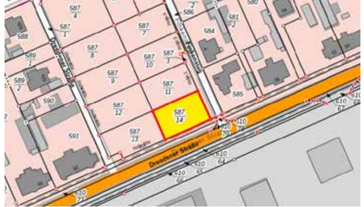
Der Standort der Doppelhaushälfte, die Einfahrt zum Grundstück erfolgt über die Dresdener Straße