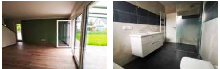
Wohnzimmer mit Terrasse Richtung Garten