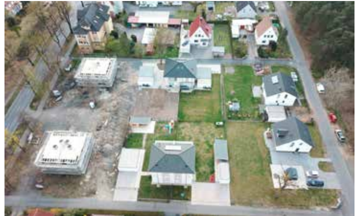
Der Rohbau steht. Ein möglicher Einzugstermin ist 2023.