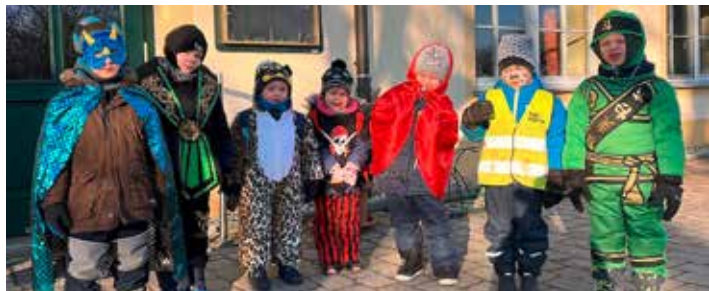
Kinder der CSB-Kita „Fuchs und Elster“ in Wiednitz

Die Kinder und ihre Erzieherinnen bedanken sich herzlich bei den Einwohnern von Wiednitz und Straßgräbchen für die prall gefüllten Zamperdosens!