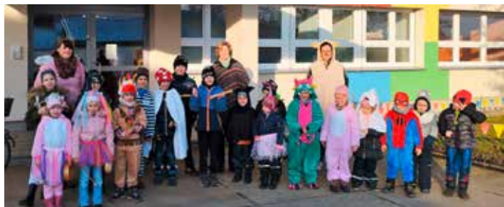
Kinder der CSB-Kita „Meisennest“ in Straßgräbchen